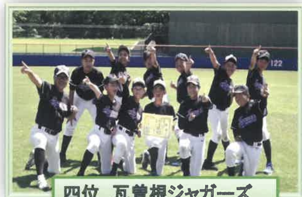
四位 瓦曾根ジャガーズ

上位チームは越子育連推薦で上部大会に出場しました。 ※東武よみうり新聞社旗争奪少年野球大会 山野ガッツ、瓦曾根ジャガーズ、イースドラゴンズ、鷲越タイガーズナイン ※彩南大会 間久里スネークス、東越谷ジュニアホープス、北越谷少年野球クラブ、川柳コンバット ※草加近隣大会 越谷スラッカーズ、せんげん台F B、宮本ヤンキース