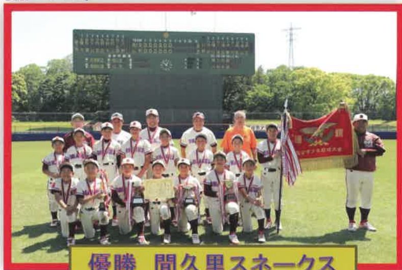
優勝 間久里スネークス

決勝戦では、季節外れの暑さの中、間久里スネークス(先攻)と山野ガッツ(後攻)の宿命のライバル対決が繰り広げられました。1回表の間久里スネークスが3点を一気に取り、3回裏山野ガッツが2点を返すも、流れを変えることができず、6対2で間久里スネークスが優勝しました。