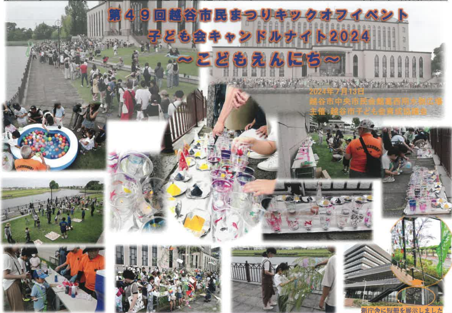
新庁舎に短冊を展示しました