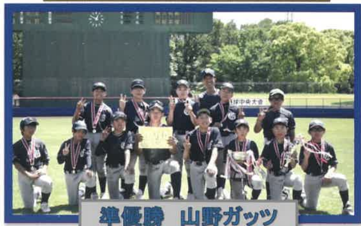
準優勝 山野ガッツ