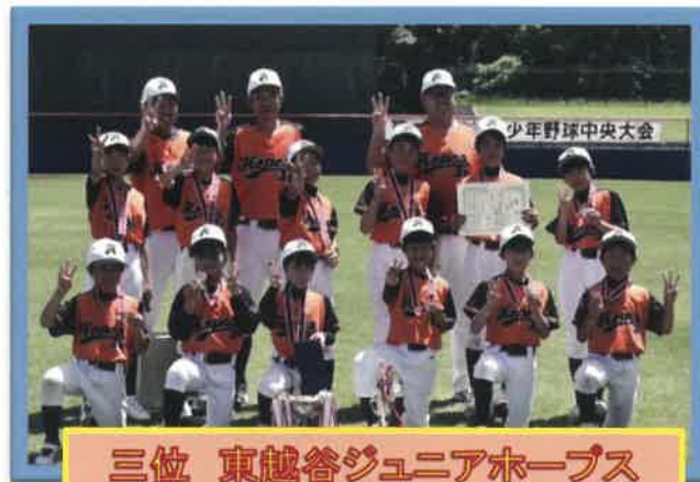
三位 東越谷ジュニアホープス