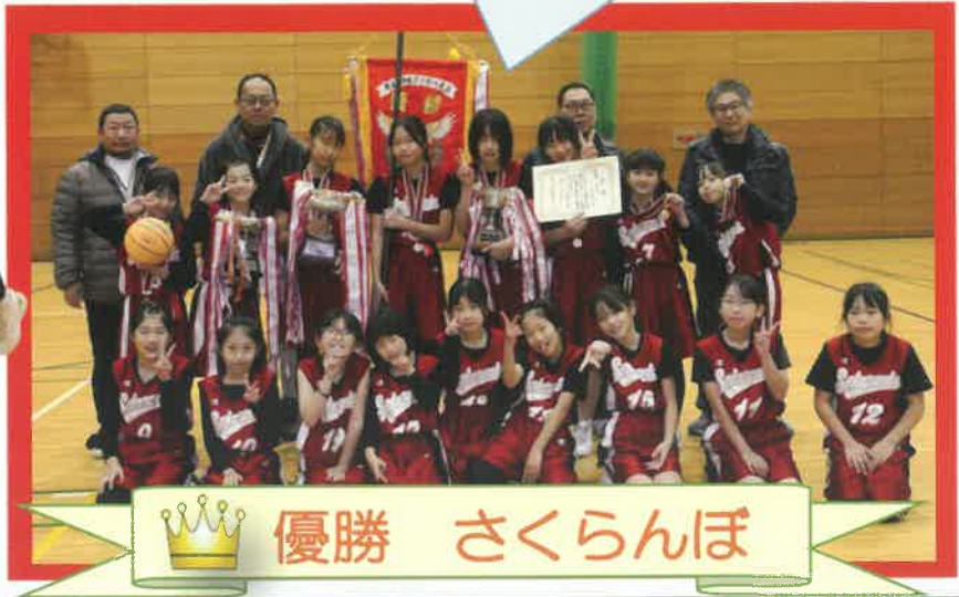
👑 優勝 さくらんぼ