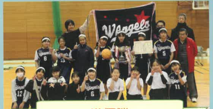
準優勝 ホワイトエンジェルス