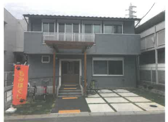
ユニバーサルデザインを取り入れた建物です。安心してお越しいただけます。木の香りあふれる癒しの空間です。