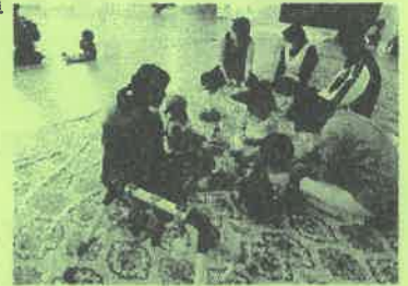
詳細&申込みは児童館へ