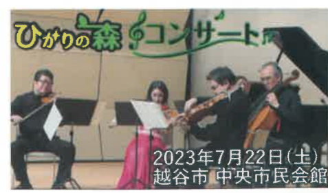
2023年7月22日(土) 越谷市 中央市民会館

NHK 交響楽団首席奏者3名とコバケントその仲間たちオー ケストラ コンサート・ミストレス、ピアニストが、平和へ誘う世界 の名曲を演奏。素晴らしい演奏を堪能させて頂きました。 日頃お世話になった方々への感謝と視覚障がい者に音楽を 楽しんでいただきたいとの思いを込めコンサートを開催しまし た。当日は、賛助会員はじめ、34名のボランティアの協力をいた だき、開催する事が出来ました。厚く御礼申し上げます。