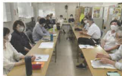
第15回 通常総会 2023年6月17日(土)