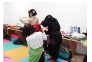
▲おりがみ「越谷市赤十字奉仕団」 ▲こども遊び「どんじやら・ほい」 ▲着物体験「こしがや市民活動連合会」

こども遊びでは紙芝居やおりがみマジック、工作を親子で楽しみ、おりがみ コーナーではお内裏様とお雛様を作りました。 着物体験では、着物を着せてもらい「越ヶ谷宿の雛めぐり」へ出かけ、まち歩 きを楽しみました。