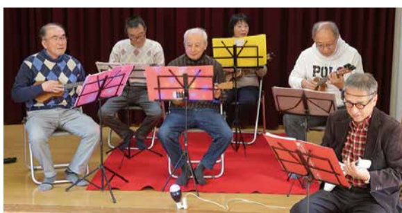
▲アホカ・ハワイアンズ (ウクレレ演奏)

大事にしていることは参加への気軽さで す。用事がなければ家で過ごしがちな日々。 用事を作って外に出ればみんなに会えま す。行きたいときに行ける、そんな自由な 学び場です。