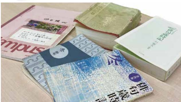
▲会員の句帳と歳時記