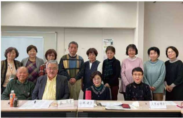
▲「群星」の紫陽花句会のみなさん