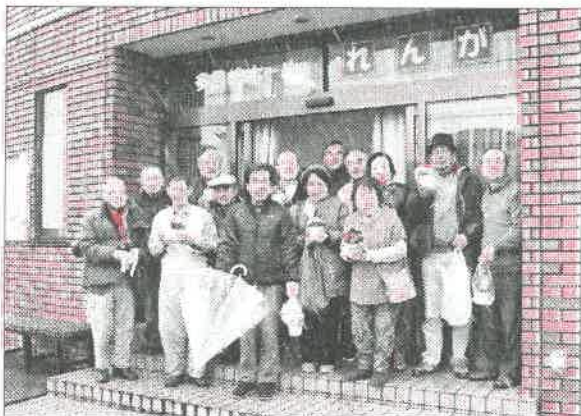
12,1,2月生まれの方右から