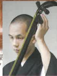
津軽三味線 五錦雄互