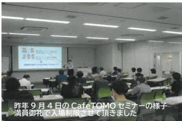
昨年9月4日のCafe TOMOセミナーの様子 満員御礼で入場制限させて頂きました

上級相続支援コンサルタント 宅地建物取引士 トータルライ フコンサルタント 米国公認不 動産経営管理士 不動産業界歴 13年。出身地は群馬県。趣味は ネットショッピング、サッカー 観戦。時刻表と路線図に強い ので観光業と不動産業にはうっ つけ