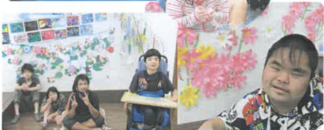
ボードはみんなの自信作