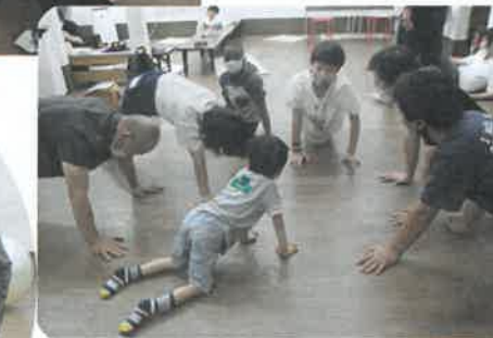
室内でいろいろ遊ぼう