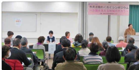
〈パネルディスカッションの様子〉