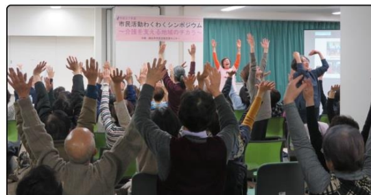
〈みんなで笑いヨガを体験〉

パネルディスカッションでは「みんなで支える介護」のテーマにそって、各団体の詳しい活動内容と、介護施設でボランティアの方々活躍の様子も分かりました。